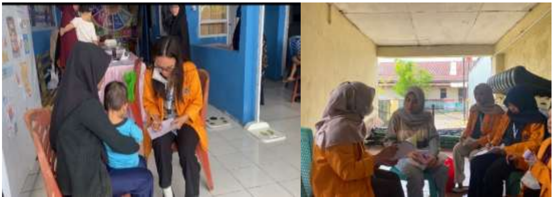
Gambar 3 Kegiatan Diskusi dan Tanya Jawab

Pelaksanaan diskusi dan tanya jawab pada kegiatan pengabdian di Puskesmas Antang Perumnas berlangsung secara interaktif dan partisipatif. Ibu balita terlibat dengan mengajukan berbagai pertanyaan terkait materi gizi kurang, seperti cara mengenali tanda-tanda awal, pemilihan makanan bergizi, serta praktik pemberian makan yang sesuai usia anak. Kegiatan ini memberikan kesempatan bagi peserta untuk memperjelas pemahaman mereka terhadap materi yang telah disampaikan melalui Smart Mini Book.