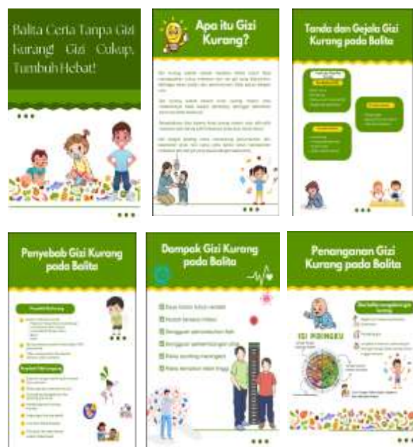
Gambar 1 Media Edukasi

Berdasarkan hasil observasi awal, disusun rencana pelaksanaan program edukasi menggunakan Smart Mini Book sebagai media literasi gizi kurang bagi ibu balita di Puskesmas Antang Perumnas. Perencanaan kegiatan meliputi penentuan sasaran peserta, jadwal pelaksanaan, tempat kegiatan, serta pembagian tugas tim pelaksana. Selain itu, dilakukan penyusunan materi Smart Mini Book yang berisi pengertian gizi kurang, penyebab, tanda-tanda, dampak, pencegahan, dan pola pemberian makan sehat pada balita. Desain media dibuat menarik, ringkas, dan mudah dipahami agar sesuai dengan kebutuhan ibu balita.