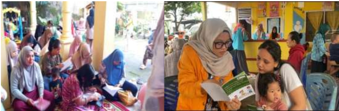
Gambar 2 Kegiatan Edukasi pada Ibu Balita

Kegiatan edukasi yang dilakukan di 3 posyandu menitikberatkan pada pentingnya peran gizi seimbang bagi balita. Edukasi ini dilaksanakan dengan metode interaktif yang meliputi ceramah, sesi tanya jawab, serta pemberian kuis yang bertujuan untuk meningkatkan pemahaman dan kesadaran ibu terkait kebutuhan gizi yang tepat dalam mendukung tumbuh kembang anaknya. Media yang digunakan dalam kegiatan ini sangat informatif berupa mini book yang praktis sebagai alat bantu visual, sehingga materi yang disampaikan dapat diterima dengan baik dan lebih mudah diingat oleh para peserta.