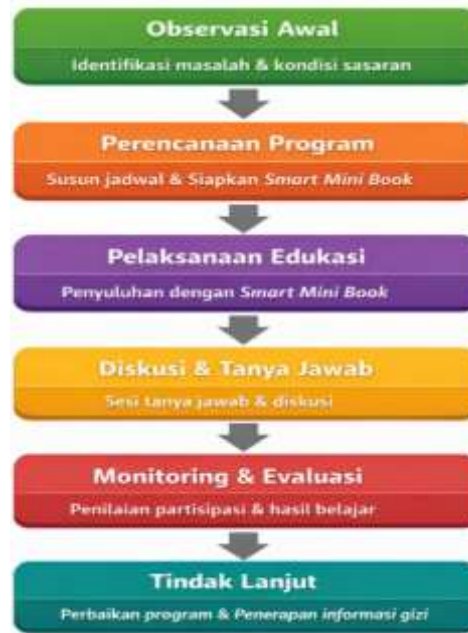
Gambar 4 Alur Pelaksanaan Kegiatan